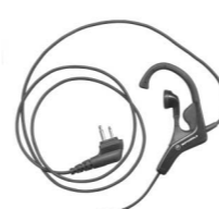
Auricolare VOX con microfono HMN9039