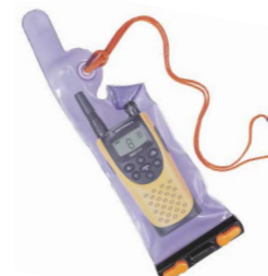
Borsa impermeabile ENLN4042