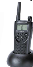
Caricabatterie Euro IXPN4001