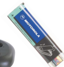
Pacco batterie di riserva NTN8971 o NNTN4190