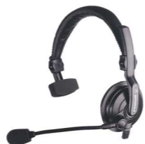
Cuffia con microfono integrato ENMN4002