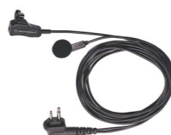
Auricolare con Microfono PTT HMN9025