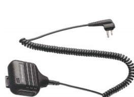
Altoparlante microfono remoto HMN9026